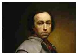
AUTORITRATTO ANTON RAPHAEL MENGES MUSEO DELL'ACCADEMIA LIGUSTICA DI BELLE ARTI PALAZZO DELL'ACCADEMIA