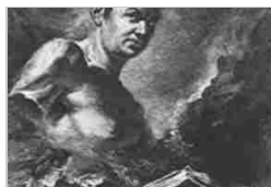
GIOVANNI BATTISTA PIRANESI (GIAMBATTISTA)