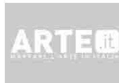
MUSEO DEL DUOMO FIRENZE