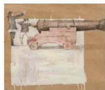
Flash d'arte con Massimo Lagrotteria