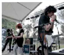
Universi piccolissimi con The Perris