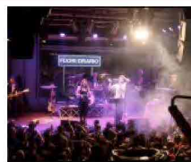
"Il diavolo e l'acquasanta" insieme per uno show esplosivo