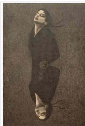
Omar Galliani , Disegno siamese, matita su tavola, 2006

Sabato 3 novembre inaugurazione del progetto espositivo curato da Edoardo di Mauro